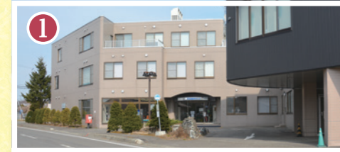
1 あびら追分クリニック 徒歩 22分~24分