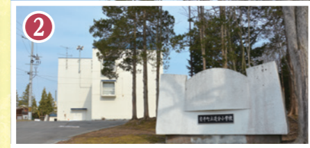
2 追分小 徒歩 28分~30分