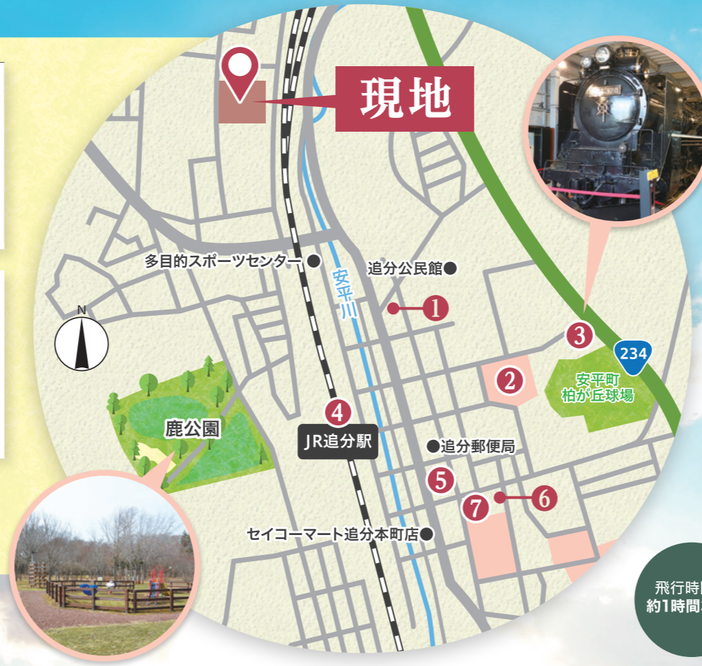
7 おいわけ子ども園 徒歩 27分~29分