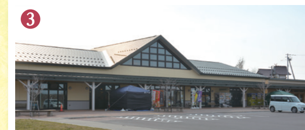
3 道の駅あびら D51ステーション 徒歩 35分~37分